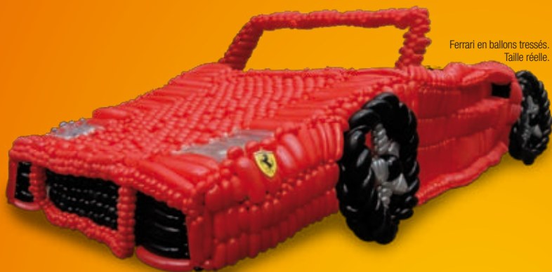
Ferrari en ballons tressés. Taille réelle.