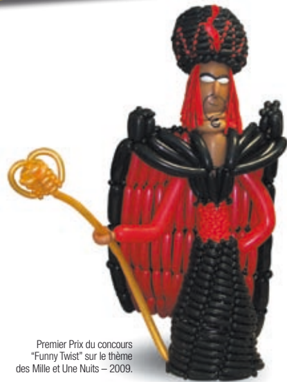
Premier Prix du concours "Funny Twist" sur le thème des Mille et Une Nuits – 2009.